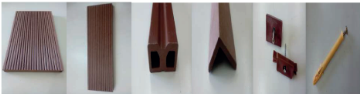
Tabla deck 140x21mm Zocalo 70x11mm Vigueta 60x30mm Ángulo 45X40MM Separador c/tor inox Tarugo c/tornillo